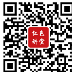
“红色讲堂”数据库微信端二维码