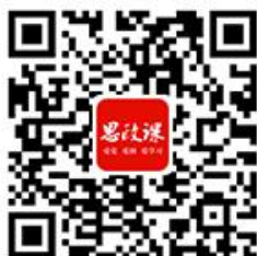
“思政课”数据库微信端二维码

(2) 通过“思政课”或者“红色讲堂”数据库微信端登录竞赛考场；竞赛考场在活动期间全天 24 小时开放。